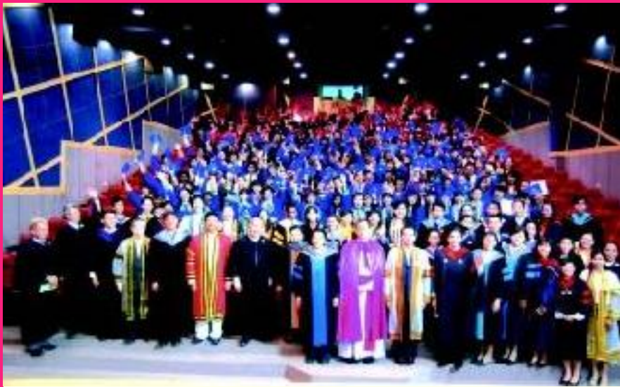
“วันแห่งความสำเร็จ” โรงเรียนคาราสมุทรบริหารธุรกิจ จัดงาน DBAC Graduation's Day 2009 ให้แก่นักเรียนระดับ ปวช.3 และนักศึกษาาระดับ ปวส.2 โดยพระคุณเจ้าสิทธิพงษ์ จรัสศรี ประมุขสังฆมณฑลจันทบุรี เป็นประธาน เมื่อวันที่ 7 มีนาคม 2010