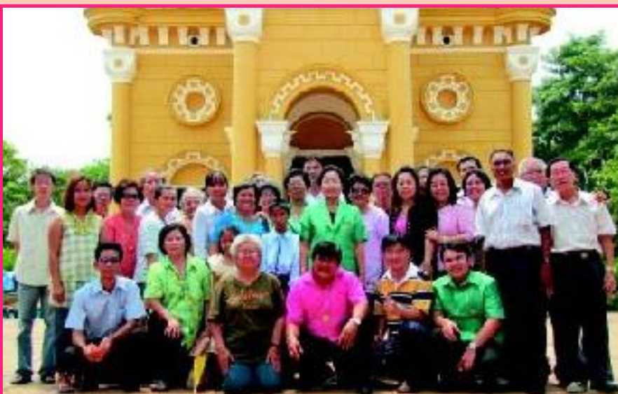
“เยี่ยมเยียน” แผนกส่งเสริมชีวิตครอบครัว (สชค.) อัครสังฆมณฑลกรุงเทพฯ นำสมาชิกสชค. เยี่ยมเยียนที่น่องสชค. วัดนักบุญยอแซฟ อูซุยา โอกาสฉลองวัด เมื่อวันที่ 13 มีนาคม 2010