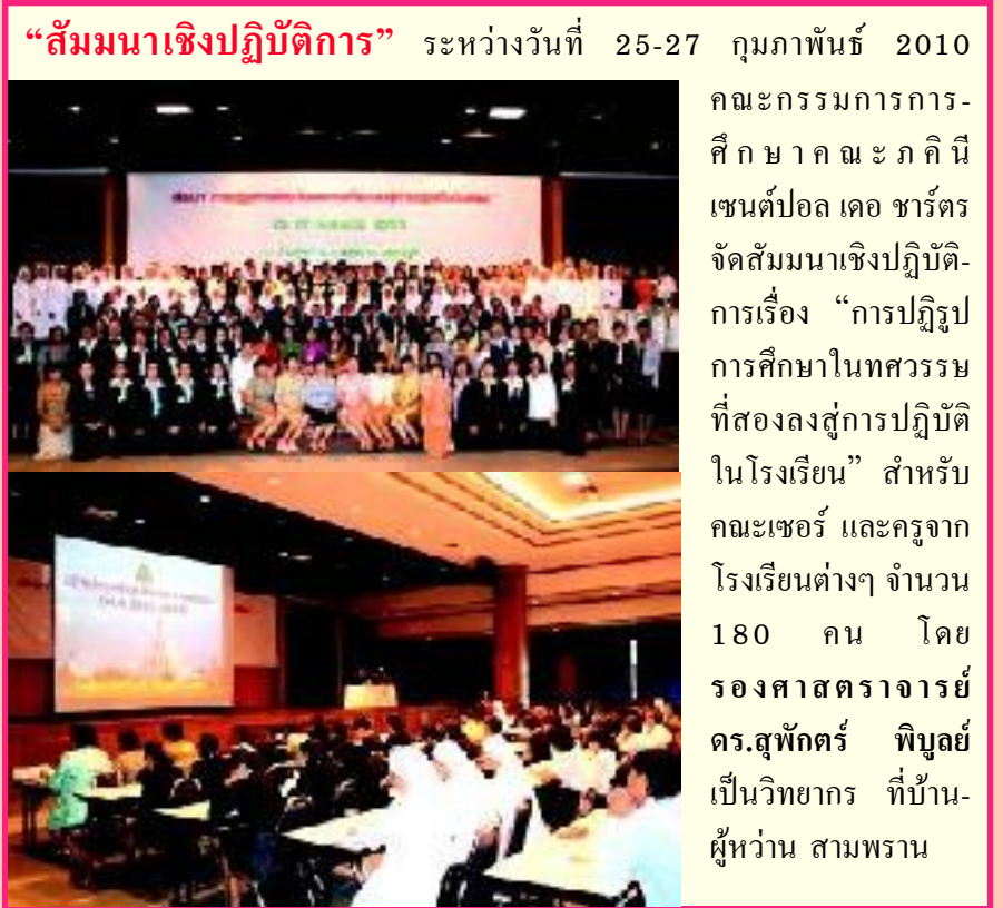
“สัมมนาเชิงปฏิบัติการ” ระหว่างวันที่ 25-27 กุมภาพันธ์ 2010 คณะกรรมการการศึกษา คณะกิตินี้ เซนต์ปอล เดอ ชาร์ตร์ จัดสัมมนาเชิงปฏิบัติการเรื่อง “การปฏิรูปการศึกษาในทศวรรษที่สองลงสู่การปฏิบัติในโรงเรียน” สำหรับคณะเซอร์ และครูจากโรงเรียนต่างๆ จำนวน 180 คน โดยรองศาสตราจารย์ ดร.สุพักตร์ พิบูลย์ เป็นวิทยากร ที่บ้านผู้หว่าน สามพราน