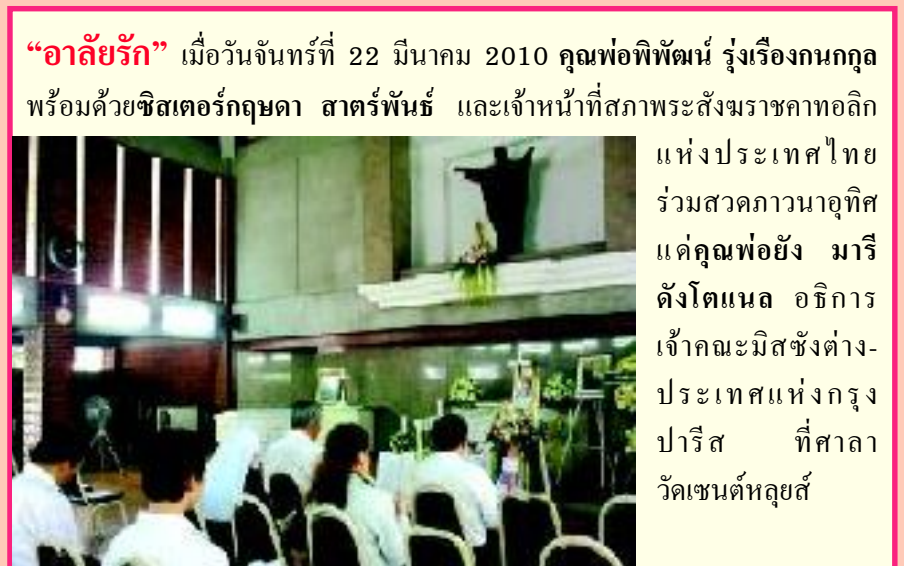
“อาลัยรัก” เมื่อวันจันทร์ที่ 22 มีนาคม 2010 คุณพ่อพิพัฒน์ รุ่งเรืองกนกกุล พร้อมด้วยซิสเตอร์กฤษดา สาตร์พันธ์ และเจ้าหน้าที่สภาพระสังฆราชคาทอลิก แห่งประเทศไทย ร่วมสวดภาวนาอุทิศ แต่คุณพ่อ ยัง มารี ดั่งโตนด อธิการ เจ้าคณะมิสซังต่าง-ประเทศแห่งกรุง ปารีส ที่ศาลา วัดเซนต์หลุยส์