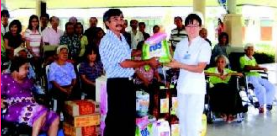
“เยี่ยม-ให้กำลังใจ” สภากิบาล กลุ่มผู้สูงอายุ และทุกกลุ่มงานของวัดราชินี แห่งสันติสุข สุขุมวิท 101 นำสิ่งของและปัจจัยไปเยี่ยมศูนย์สงเคราะห์บ้านหทัย-การณย์ และศูนย์อภิบาลผู้สูงอายุและเด็กโรงพยาบาลเซนต์หลุยส์ ลำไทร เมื่อวันที่ 6 มีนาคม 2010