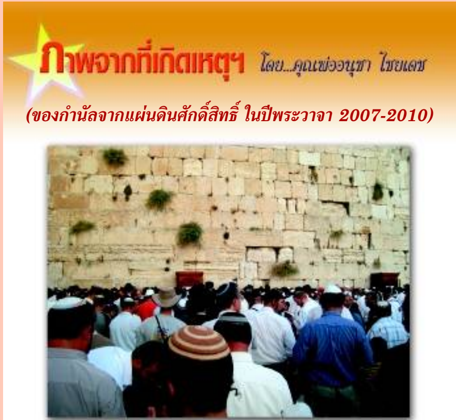
ภาพจากที่เกิดเหตุ (ของกำนัลจากแผ่นดินศักดิ์สิทธิ์ ในปีพระวาระ 2007-2010)