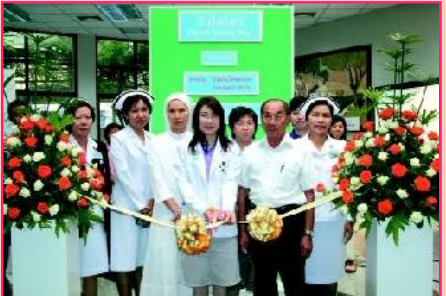
“วันไต้โลก” ทีมแพทย์และพยาบาล ศูนย์โรคไต โรงพยาบาลเซนต์หลุยส์ ร่วมจัดกิจกรรมบริการสุขภาพเพื่ออยากเห็นคนไทยมีสุขภาพไต้ดี โดยให้ความรู้เกี่ยวกับการใช้ยา และแนะนำวิธีการดูแลผู้ป่วยโรคไตให้กับผู้ใช้บริการ เนื่องในโอกาสวันไต้โลกที่ผ่านมา