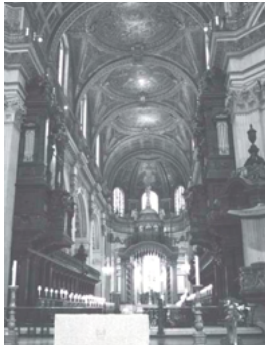
“Easter Day in London”