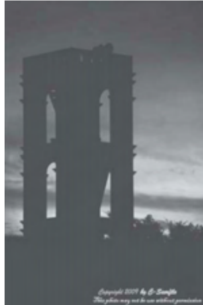
“เด็กตีระฆังวัด” กระแสเรียกผม เริ่มต้นที่นี่ ผู้ส่ง Long Mongdo C