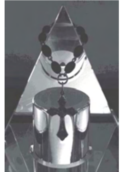
“มาแบ่งปันได้ของขวัญวันเกิดมา” ผู้ส่ง A House Blessing