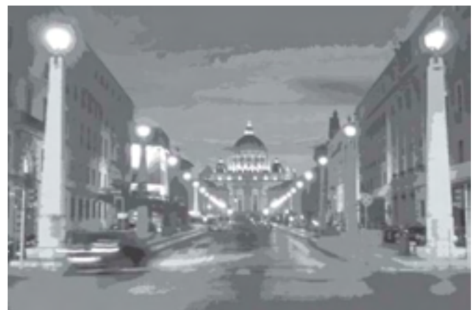
“ทางสว่างสู่บ้านพระบิดา” ผู้ส่ง Nitta Muang Mee Ros