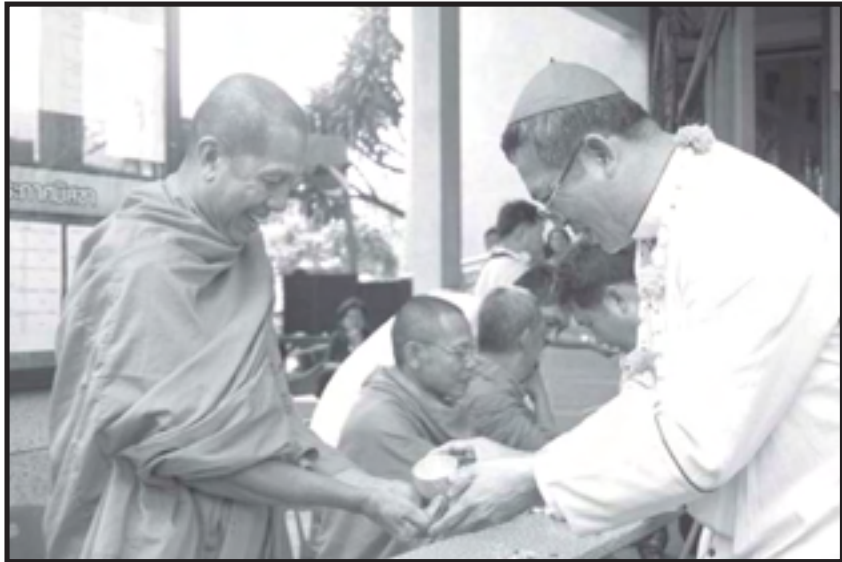
“มิตรภาพ...ศาสนสัมพันธ์” เมืองไทย คนไทยรักกันไม่แบ่งแยกศาสนา ผู้ส่ง Warunee Tanwattana