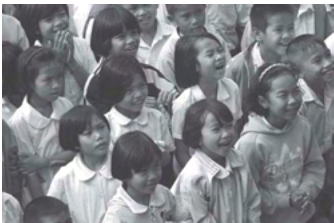
“รอยยิ้มของน้องที่สุโขทัย” ผู้ส่ง Oranuch Somsuk