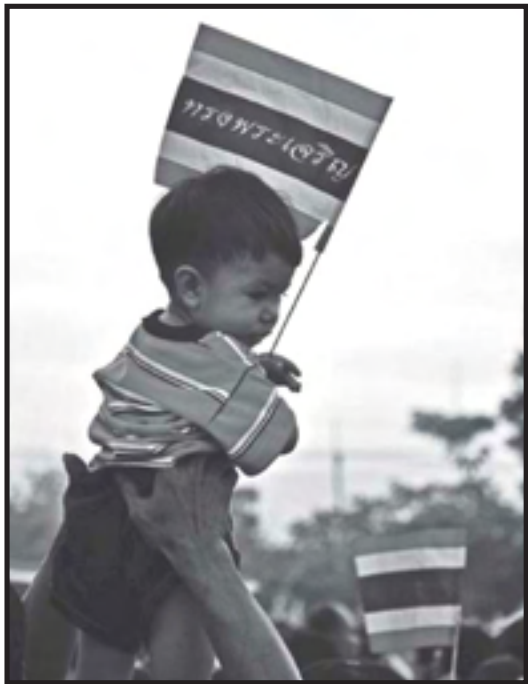
“ไทยสามัคคี ไทยเข้มแข็ง” ร้องเพลงชาติไทย 76 จังหวัด ผู้ส่ง Fernn Pantira Satwinit