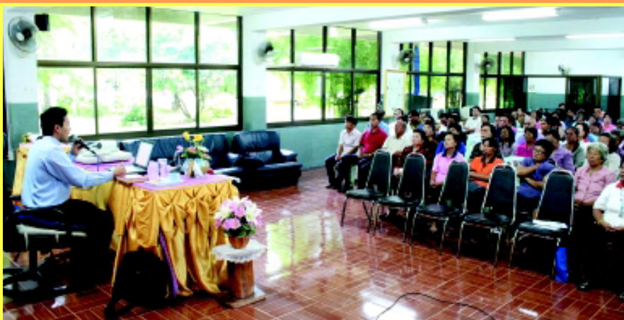
“อบรม” อบรมพระคัมภีร์เบื้องต้นและเรื่องศีลสมรส ซึ่งจัดโดยพระสงฆ์และกรรมการบิอชีเขตกลางของอัครสังฆมณฑลท่าแร่-หนองแสง ที่ห้องประชุมโรงเรียนท่าแร่ศึกษา มีผู้เข้าร่วมกว่า 100 คน