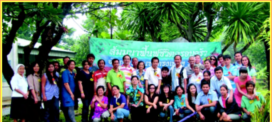
“สัมมนา” แผนกส่งเสริมชีวิตครอบครัว (สชค.) อัครสังฆมณฑลกรุงเทพฯ จัดสัมมนาฟื้นฟูชีวิตครอบครัว ชั้นที่ 1 (ฟฟ.1) รุ่นที่ 128 ระหว่างวันที่ 17-19 กันยายน 2010 ที่บ้านสวนขอแซฟ สามพราน นครปฐม มีผู้เข้าร่วมสัมมนาจำนวน 17 คู่ (เป็นคาทอลิก 5 คู่ พุทธ 10 คู่ ต่างคนต่างถือ 2 คู่) คู่ที่เป็นคาทอลิกมาจากเขต 1 วัดอัครเทวดาราฟาแอล ปากน้ำ วัดเซนต์หลุยส์ เขต 2 วัดแม่พระองค์อุปถัมภ์ เขต 3 วัดธรรมาสันนิกบุญเปโตร (บางเข็กหนึ่ง) ต่างคนต่างถือ มาจากเขต 1 วัดอัครเทวดาราฟาแอล ปากน้ำ และเขต 6 วัดนักบุญยอแซฟ อุดรฯ (จัดสัมมนารุ่นต่อไปรุ่นที่ 129 วันที่ 19-21 พฤศจิกายน 2010)