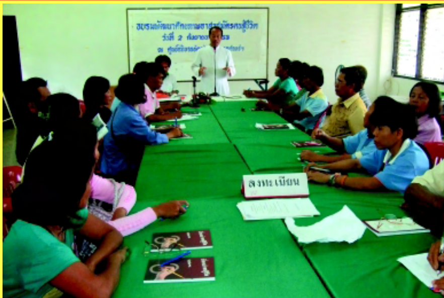
“ช่วยเหลือ” อาสาสมัครเพื่อสังคม จัดประชุมอบรมพัฒนาศักยภาพอาสาสมัครคนสู้ชีวิตและมอบทุนสนับสนุนกิจกรรมอาสาสมัครเพื่อสังคม เมื่อวันที่ 2 กันยายน 2010 มีผู้เข้าร่วม 21 คน จาก 7 หมู่บ้าน โอกาสนี้อาสาสมัครได้มีการแลกเปลี่ยนเรียนรู้การทำงานด้านอาสาสมัคร และมีการวางแผนงานการทำงานในระดับชุมชนเพื่อช่วยเหลือดูแลผู้ด้อยโอกาสในชุมชน ที่ศูนย์อภิบาลอัครสังฆมณฑลท่าแร่-หนองแสง

ระดับภาค “เวทีสมัชชาคุณธรรม” ภาคกลาง ปี 2553 วันอังคารที่ 14 กันยายน ที่โรงแรมเจ้าพระยาปาร์ก จัดโดยศูนย์คุณธรรมไทยพัฒนา ผู้เข้าร่วมงาน 5 ศาสนา คือ ศาสนาพุทธ ศาสนาคริสต์ ศาสนาอิสลาม ศาสนาพราหมณ์-ฮินดู และศาสนาซิกข์ เพื่อให้ทุกศาสนาทุกอาชีพได้มีส่วนร่วมในการคิดข้อเสนอแนะปฎิญญาคุณธรรม ข้อัตติยร์รับผิดชอบพอเพียงและแผนปฏิบัติการให้เกิดขึ้นเป็นรูปธรรมในสังคมไทย