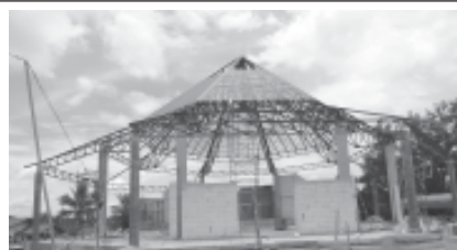
วัดนักบุญคามิลโล เป็นวัดสาขา ที่ขึ้นกับ “วัดแม่พระบังเกิด” อ.เมือง จ.เชียงราย