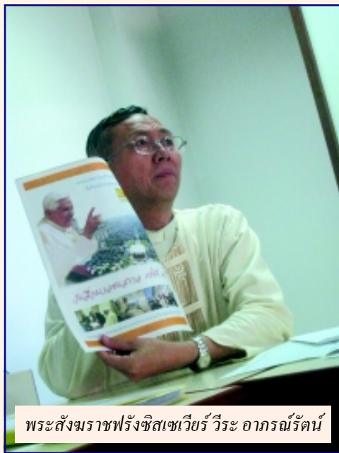
พระสังฆราชฟรังซิสเซเวียร์ วีระ อาภรณ์รัตน์

สมเด็จพระสันตะปาปาเบเนดิกต์ ที่ 16 ทรงเปิดตัวเดออร์ของสำนักวาติกัน โอกาสครบ 60 ปีที่ทรงบวชเป็นพระสงฆ์