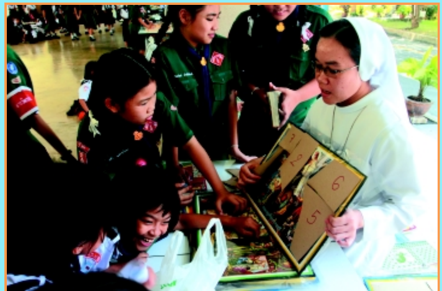
“สัปดาห์พระคัมภีร์” ระหว่างวันที่ 4-8 กรกฎาคม 2011 โรงเรียนนารีวุฒิ จัดสัปดาห์พระคัมภีร์ เพื่อเป็นการส่งเสริมการอ่าน ค้นหาข้อคิด แนวปฏิบัติชีวิต จากพระคัมภีร์ ทั้งนักเรียนคาทอลิกและนักเรียนทุกศาสนา กิจกรรมมีการเรียนรู้ บุคคลจากพระคัมภีร์ การอ่านพระคัมภีร์ ระบายสีภาพจากพระคัมภีร์ และอื่นๆ