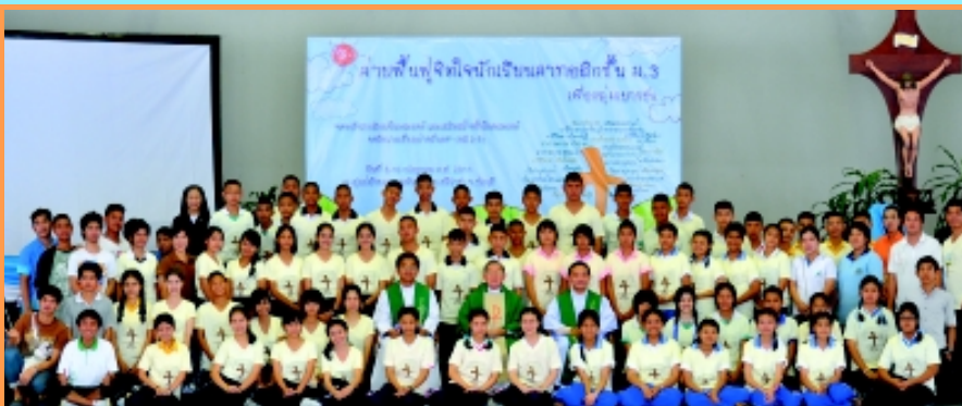
“ค่ายฟื้นฟูจิตใจนักเรียนคาทอลิกชั้น ม.3” ระหว่างวันที่ 8-10 กรกฎาคม 2011 ที่แผนกของสังฆมณฑลจันทบุรี ได้แก่ แผนกเยาวชน แผนกคำสอน แผนกแพร่ธรรม และแผนกครอบครัว ได้จัดค่ายฟื้นฟูจิตใจนักเรียนคาทอลิก ชั้น ม.3 ที่อาคารสุวรรณศรี ศูนย์สังฆมณฑลจันทบุรี ศรีราชา โดยมีพระสังฆราช กิตติคุณลอเรนซ์ เทียนชัย สมานจิต เป็นประธานในพิธีมิสซาเปิดค่าย