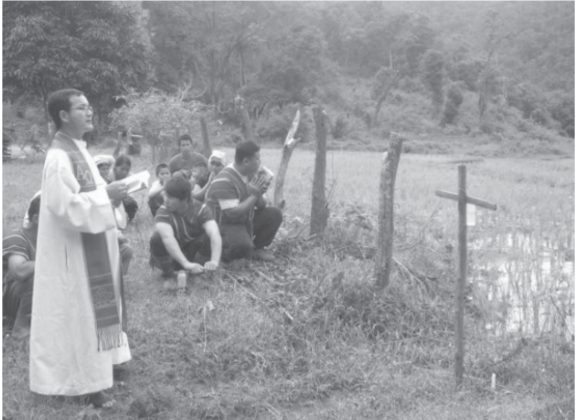
คุณพ่อนำสวดและเดินพรมน้ำเสกรอบๆ นา

“แต่ก่อนเราเลี้ยงนา เราสร้างหอบูชาสองหลัง ใช้เสาหอบูชาหอละ 4 ต้น รวม 8 ต้น ต้องฆ่าไก่ 4 ตัว เหล้า 2 ขวด มีขั้นตอนและรายละเอียดหลายอย่างกว่าจะเสร็จใช้เวลาอันมีข้อห้ามอีกเยอะแยะ หากคิดไปจากข้อห้ามถือว่าไม่ดี บางครั้งถึงกับต้องทำพิธีใหม่ก็มี เสียหมู เสียไก่ไปอีก แต่ปัจจุบันเราเป็นคริสตชนเราไปสวดในนา ก็ปักไม้กางเขน 1 อัน น้ำเสกอีก 1 ขวด สวดขอบคุณพระเจ้าและขอพรจากพระเจ้า แค่นี้ก็เสร็จ ข้อห้ามไม่มี ดีหรือไม่ดี เราเชื่อในพระเจ้าแล้ว หมูหรือไก่และเหล้าที่เราเอามา เราไม่ทำเป็นเครื่องเซ่นไหว้ เพียงนำมาประกอบอาหารเพื่อร่วมกันดื่ม