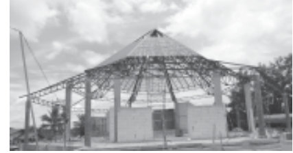
วัดนักบุญคามิลโล เป็นวัดสาขา ที่ขึ้นกับ “วัดแม่พระบังเกิด” อ.เมือง จ.เชียงราย