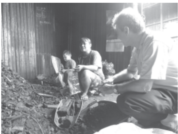
3 คนเป็นลูกชายทั้งหมด คนโตเรียน ม.1 คนที่สอง ป.6 และคนที่สาม ป.3 กำลังใช้เงินเลย เรียนที่โรงเรียน

คุณรุ่งอรุณ นำไทย รูปร่างท้วมค่อนข้างอ้วน มีลูก