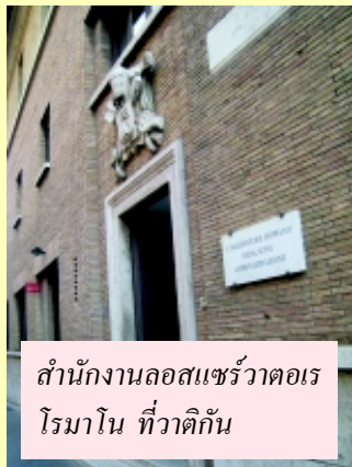
สำนักงานลอสแซร์วาตอเร โรมานโน ที่วาติกัน