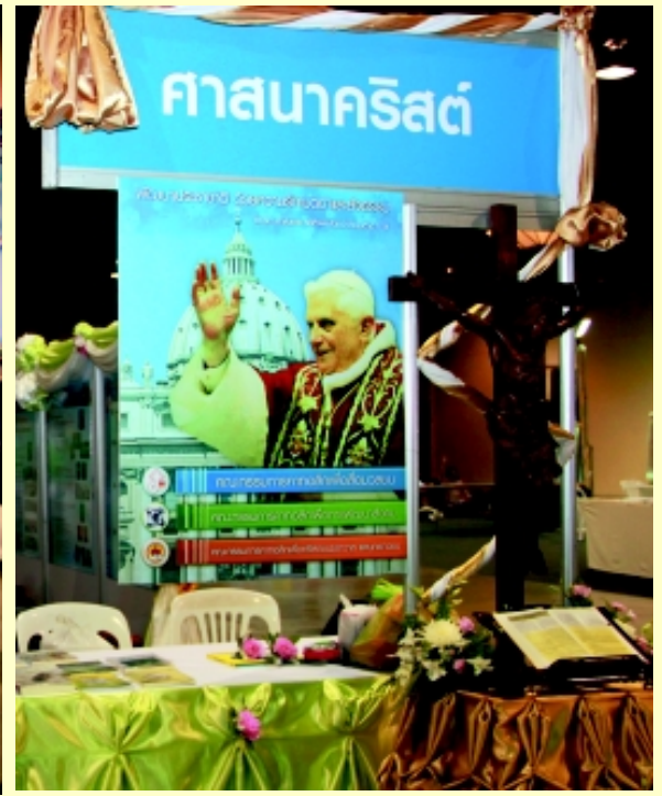
สมัชชาคุณธรรมแห่งชาติ ครั้งที่ 5 “สร้างชาติโปร่งใส สร้างไทยซื่อตรง” 21-23 กรกฎาคม 2011 อิมแพค เมืองทองธานี