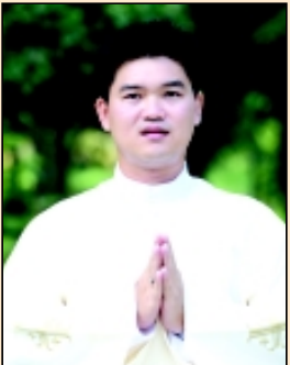
บราเดอร์ดลฐิติศักดิ์