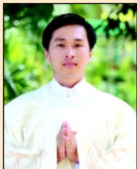
บราเดอร์หิว อัน ห่วง