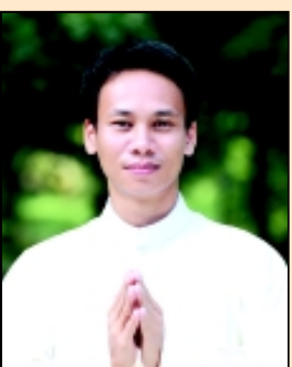
บราเดอร์ไพศาล