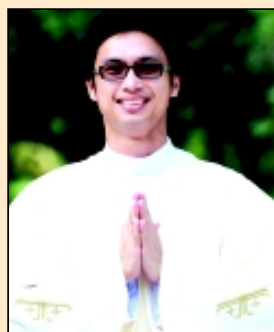
บราเดอร์ทัสมะ

ผมเข้าชมวิหารนักบุญเปโตรมาหลายครั้งแล้ว แต่เพิ่งได้เข้าไปในพิพิธภัณฑ์วาติกันครั้งแรกเมื่อตุลาคม 2010 นี้เอง ผมไม่แน่ใจว่าทำไมพิพิธภัณฑ์แห่งนี้ถึงดึงดูดคนจากทั่วโลกให้อยากมาเยี่ยมชมได้มากมาย ภาพที่นำมาลงในคอลัมน์ เป็นแถวของผู้คนยาวเหยียด (แม้ว่าเราจะมาเช้าแล้ว แต่แน่นอนมีคนมาเช้ากว่าเรา) โดยส่วนตัวแล้ว ทำให้ผมเห็นที่มาที่ไปของภาพที่เรานำมาลงปกหนังสืออุดมสาร-อุดมสานต์ ภาพที่เรานำมาทำปฏิทินภาพที่เราคิดว่าสวย ภาพจริงสวยกว่าหลายเท่าตัว มันเหมือนกับว่าความงดงามแห่งศาสนาที่เราสัมผัสได้ กับความสวยงามที่แท้จริงที่เราปรารถนาจะไปให้ถึงสักวัน มันอาจจะห่างกัน แต่มันสามารถเชื่อมโยงและระลึกถึงกันได้บ้าง