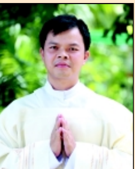
บราเดอร์เหียน วัน ถิ่น