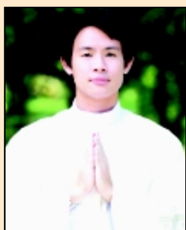
บราเดอร์สักรินทร์