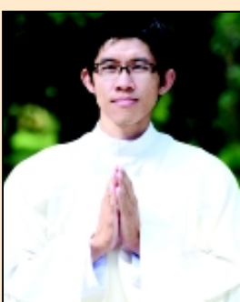
บราเดอร์ทินกร