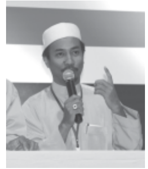
อาจารย์मितร์ ดาราฉาย

ความซื่อสัตย์ในชีวิตคู่ สิ่งสำคัญในพิธีสมรส ก็คือ การแลกเปลี่ยนความสมัครใจในการเป็นสามีและ ภรรยาของกันและกัน โดยกระทำอย่างเปิดเผยต่อ สักขีพยานว่าจะรักและซื่อสัตย์ต่อกันจนกว่าชีวิตจะหาไม่ และยังคงอธิบายเรื่องศีลอกภัยบาปว่า หมายถึง ศีลศักดิ์สิทธิ์แห่งการกลับใจ พระเจ้าทรงประทาน การอภัยและให้สันติ แก่ผู้สำนึกผิด เป็นศีลแห่งการ ก็นิดี การที่คนๆ หนึ่งได้หันชีวิตของตนเองกลับมาสู่ พระเจ้าทั้งครบ หันจากบาปความคิดที่ทำให้ชีวิตหันเห ไปจากพระองค์ ให้กลับคืนมาสู่พระเจ้าอีกครั้ง ผู้ที่ได้ สารภาพบาปกับบาทหลวง และบาทหลวงกล่าวคำ อภัยบาปให้แล้วนั้น ถือว่าพระเจ้าให้อภัยในความผิด ที่ได้กระทำไป อันเป็นการขัดเคืองพระทัยพระเจ้า แต่ ถ้าเขายังมิได้ชดใช้โทษบาปอย่างสมมูลกับความผิด ที่ได้ทำลงไป โทษของบาปยังคงติดตัวต่อไป ผู้แก้บาป แล้วต้องทำความดีเพื่อชดใช้โทษบาปจนหมดสิ้น ซึ่ง เนื้อหาที่แท้คือ ความซื่อสัตย์ต่อพระเจ้าและต่อ เพื่อนมนุษย์