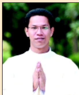
บราเดอร์วันใหม่