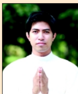
บราเดอร์สมชาย