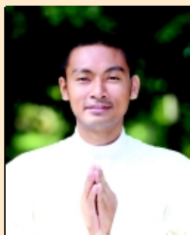
บราเดอร์เปรม