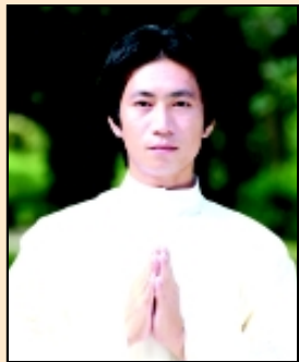
บราเดอร์เทพณรงค์