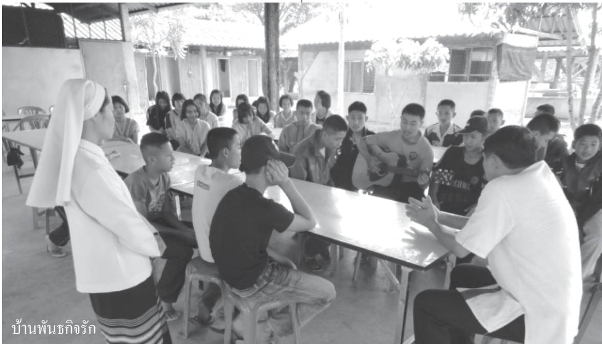
บ้านพันธกิจรัก

“คุณพ่อช่วยเหลือเด็กเหล่านี้ทั้งหมด โดยเฉพาะ เด็กยากจน แต่ครอบครัวไหน พ่อแม่พอมิ พ่อช่วยเหลือ (อ่านต่อหน้า 13)