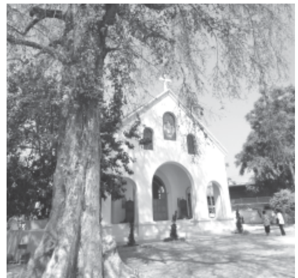
วัดนักบุญมีคาแอล การ์ริกอยส์ จอมทอง

“เวลามันมาช้าๆ สม่่าเสมอ เต็ดขาด ชัดเจน สำหรับทุกคน!” ☺