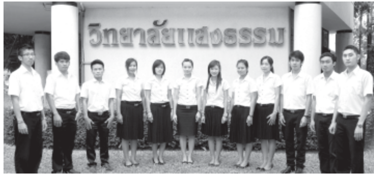
นักศึกษาชั้นปี 3 สาขาวิชาคริสตศาสนศึกษา วิทยาลัยแสงธรรม

เสริมสร้างสังคมที่ดีงาม และเห็นประโยชน์ส่วนรวมมากกว่าประโยชน์ส่วนตัว” (หน้า 39 ข้อ ข)