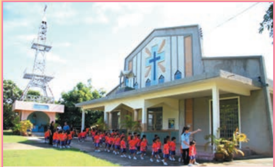
“เปิดวัดเป็นแหล่งเรียนรู้” วัดแม่พระถวายเป็นพระวิหาร ลูกแก ในฐานะเป็นจุดกำเนิดและแหล่งเรียนรู้ศาสนาคริสต์ของโรงเรียนธีรศาสตร์ เปิดวัดสำหรับนักเรียนโรงเรียนธีรศาสตร์ (อนุบาล) มาเยี่ยมชมวัด โดยมีคุณพ่อและคณะครูให้การต้อนรับและอธิบายวัดให้นักเรียนได้เรียนรู้ เมื่อต้นเดือนสิงหาคมที่ผ่านมา