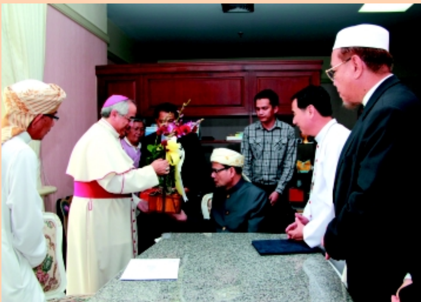
พระสมณทูตมอบกระเช้ากล้วยไม้เป็นที่ระลึกแก่จุฬาราชมนตรี