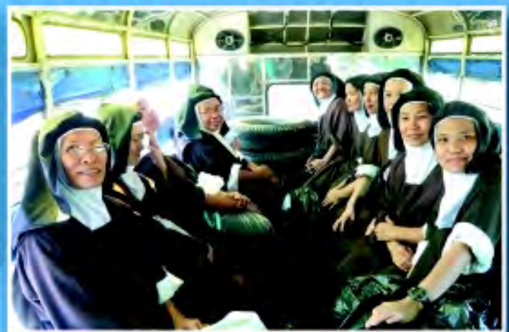
มาเซอร์คาร์เมโลต์ นครสวรรค์ ยายที่ปักชื่อคราว