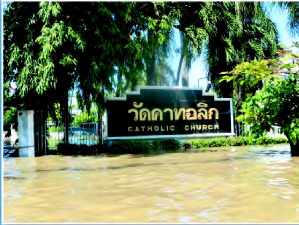
(ภาพบน) อาสนวิหารนักบุญอันนา นครสวรรค์ (ภาพขวา) วัดนักบุญลูคา บางขาม ลพบุรี