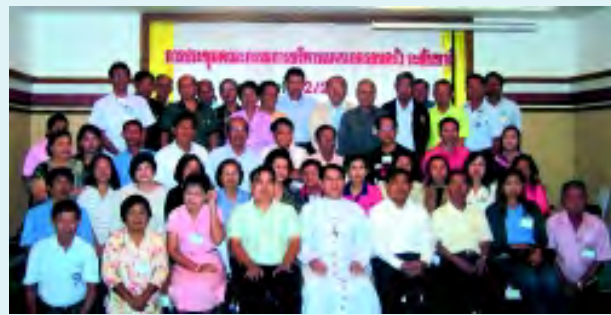
“ประชุมคณะ กรรมการ บริหารแผนก ครอบครัวระดับ ชาติ” สังฆมณฑล นครราชสีมา เป็น