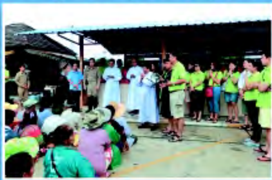
มอบความช่วยเหลือ