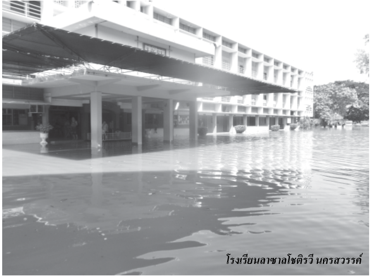
โรงเรียนลาซาลโชติรวีนครสวรรค์

ท่าซุง จ.อุทัยธานี กล่าวว่า “น้ำท่วมที่วัดทั้งหมด ถึงพระแท่น บ้านพักพระสงฆ์ที่ท่วม ตั้งแต่ผมโตจนอายุ 60 ปี ถือว่าปีนี้หนักที่สุดในเขต จ.อุทัยธานี เสียหายมากชาวบ้านรอบๆ วัดเป็นพุทธ แต่เราก็ช่วยเหลือกัน ตอนนี้ทุกคนเครียดเพราะน้ำยังไม่ยอมลง ถนนเส้นอุทัยฯ มุ่งหน้ามาวัดนักบุญเปโตร ท่าซุง ถูกตัดขาดต้องใช้เรือในการสัญจรไปมา น้ำท่วมที่องศา 3-4 เมตร หลังจากน้ำลดแล้วอยากให้ช่วยเหลือเกษตรกรเป็นหลัก เช่น เมล็ดพันธุ์ข้าว ปุ๋ย ยา ผมย้ายไปอยู่หมู่ 7 โกรกพระวันนี้จิตใจที่คาทอลิกมาแจกถุงยังชีพ”