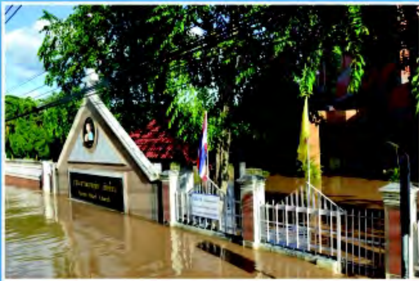
อาสนวิหารพระหฤทัย เชียงใหม่