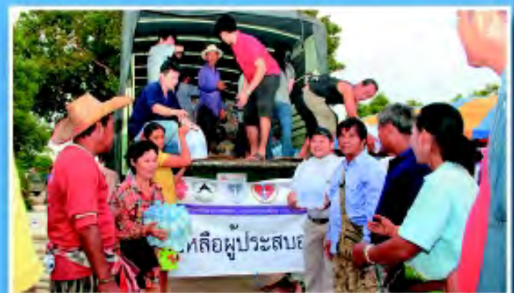
วัดหลุมเข้า จ.อุทัยธานี