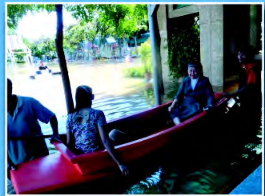
โรงเรียนเซนต์โยเซฟ นครสวรรค์