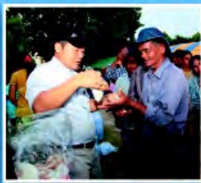
มอบถุงยังชีพ