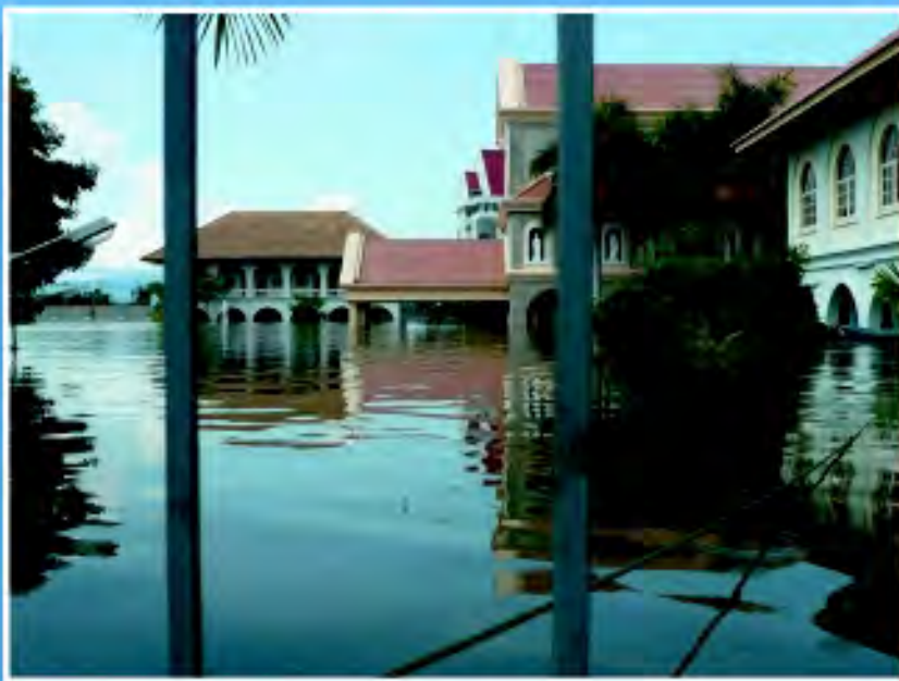
อารามคาร์เมไลท์ นครสวรรค์