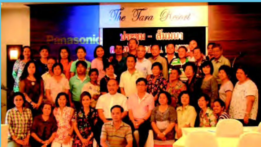
“ประชุม-สัมมนา” แผนกส่งเสริมชีวิตครอบครัว (สชค.) อัครสังฆมณฑล กรุงเทพฯ จัดประชุม-สัมมนาคณะกรรมการ เพื่อเตรียมงานการเป็นเจ้าภาพร่วม จัด “งานชุมนุมครอบครัว ระดับชาติ” หาแนวทางและกำหนดทิศทางการทำงาน ด้านครอบครัวให้มีประสิทธิภาพมากยิ่งขึ้น ระหว่างวันที่ 1-2 ตุลาคม 2011 ที่ เดอะธารา รีสอร์ท พัทยาใต้ จ.ชลบุรี มีผู้เข้าร่วมจำนวน 49 คน