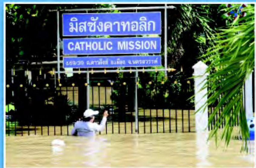
สำนักมิสซังคาทอลิก นครสวรรค์