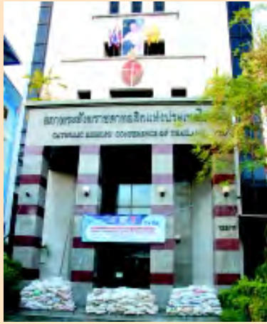
(ภาพบน) อาคารสภาพระสังฆราชคาทอลิกแห่งประเทศไทย เปิดเป็นศูนย์ประสานงานคาทอลิกเพื่อผู้ประสบภัยน้ำท่วม