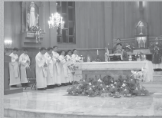
14 กุมภาพันธ์ 2553