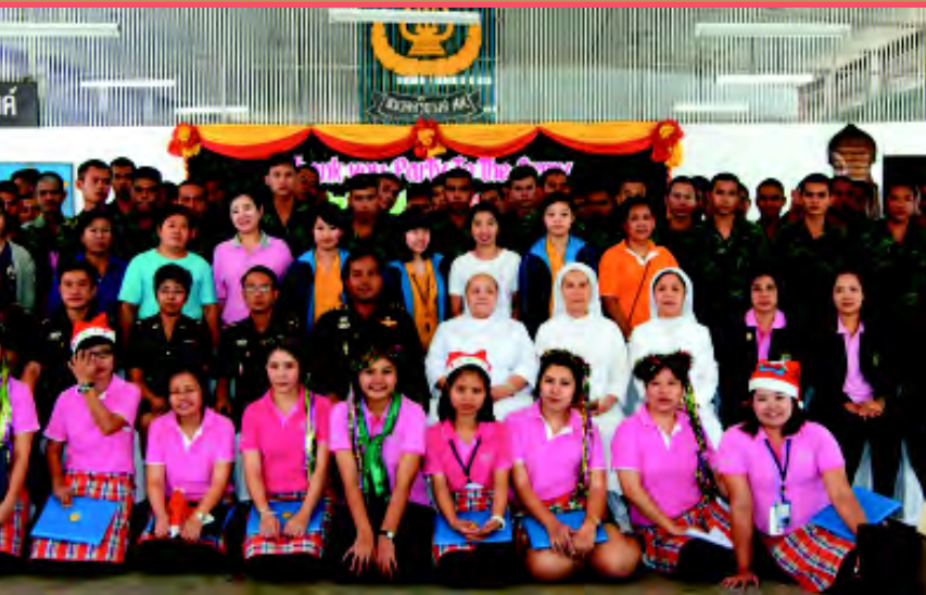
“ขอบคุณทหารของชาติ” วิทยาลัยเซนต์หลุยส์ โรงพยาบาลเซนต์หลุยส์ มูลนิธิ I-Care และสโมสรโรตารี (บางรัก) ร่วมมอบความสุขให้กับทหารของชาติที่กรมการทหารสื่อสาร สะพานแดง บางซื่อ โดยมีพลตรีภานุมาศ โกสินทรเสวี รองเจ้ากรมการทหารสื่อสาร ให้การต้อนรับ ทั้งนี้ ทหาร 300 นาย ได้รับถุงของขวัญและร่วมรับประทานอาหารแบบบริการตนเอง อีกทั้งยังร่วมกิจกรรมฉลองคริสต์มาสและปีใหม่ออย่างสนุกสนาน วิทยาลัยฯ ได้ขอพระคุณทหารใน