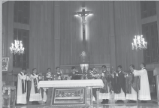
19 กุมภาพันธ์ 2551