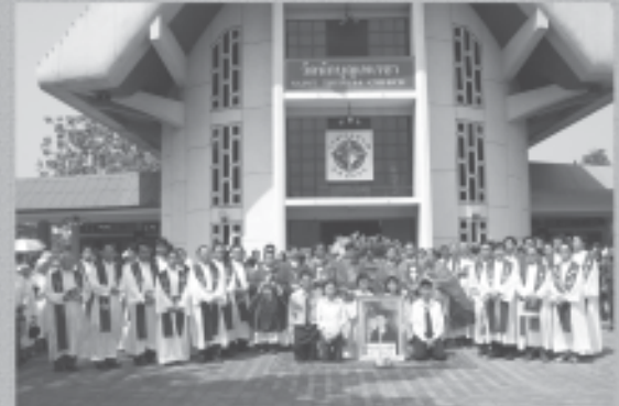
19 กุมภาพันธ์ 2551