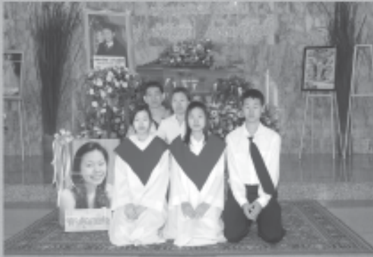
19 กุมภาพันธ์ 2551