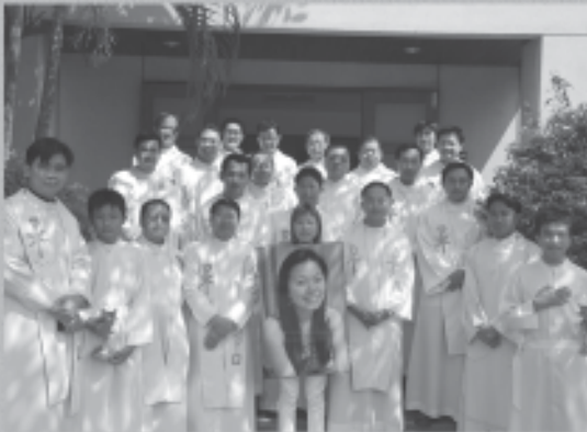
14 กุมภาพันธ์ 2552