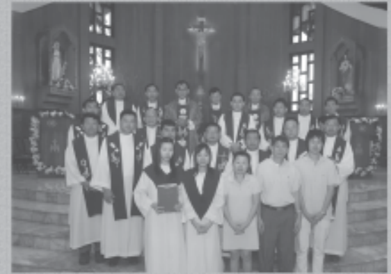
14 กุมภาพันธ์ 2554

ขอเชิญร่วมพิธีบูชาขอบพระคุณ โอกาสครบรอบ 4 ปีผู้อ้อมพระหัตถ์พระเป็นเจ้า ของ มารีอา นพภัตสร เวชไพศาลศิลป์ (น้องแนน) วันจันทร์ที่ 14 กุมภาพันธ์ 2555 เวลา 17.00 น. ณ วัดนักบุญเทเรซา หนองจอก โดยคุณพ่อ ชวลิต กิจเจริญ