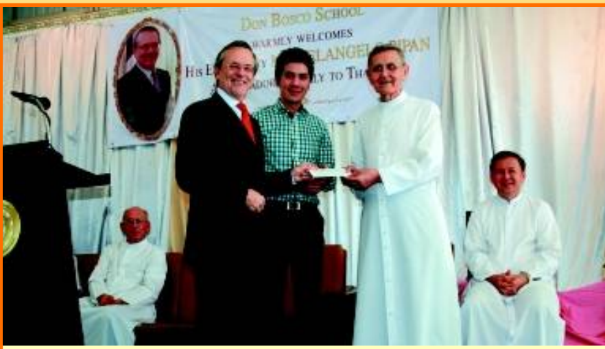
“เยี่ยมเยียน” คุณพ่อตีโต้ เปตรอน อธิการ เป็นประธานในพิธีต้อนรับ เอกอัครราชทูต Michelangelo PIPAN สถานทูตอิตาลีประจำประเทศไทย ในโอกาสเยี่ยมชมเรียนโรงเรียนดอนบอสโก กรุงเทพฯ เพื่อเชื่อมความสัมพันธ์ พร้อมมอบทุนการศึกษาให้โรงเรียน เมื่อวันที่ 15 กุมภาพันธ์ 2012