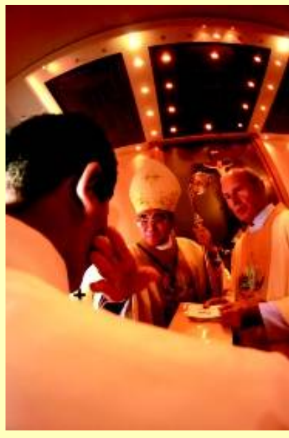
“โปรดศีลกำลัง” พระอัครสังฆราชฟรังซิสเซเวียร์ เกรียงศักดิ์ โกวิทวาณิช เป็นประธานพิธีโปรดศีลกำลัง ให้กับสัตบุรุษ จำนวน 32 คน เนื่องในโอกาส ฉลองวัดนักบุญยอห์น บอสโก กรุงเทพมหานคร เมื่อวันที่ 31 มกราคม 2012