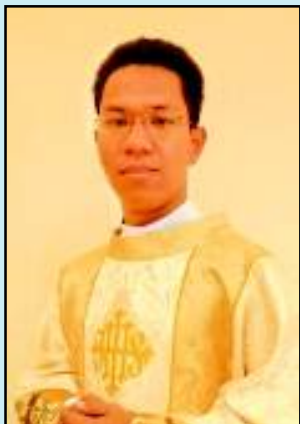
สังฆานุกรวันใหม่ ศรีสุข

สังฆมณฑล นครสวรรค์ ขอ เชิญร่วมพิธีบวช ขอ บ พระคุณ โอกาสปีแห่ง ความเชื่อและ บวชพระสงฆ์ใหม่