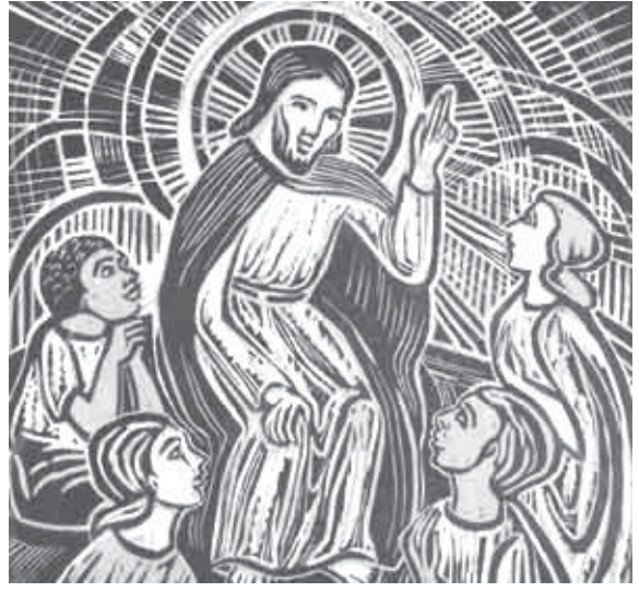
รักษาไว้เพื่อตัวเอง

พบศักดิ์ศรีและอิสระเสรีภาพของพวกท่านเอง จงนำพามนุษยชาติทั้งหลายมาหาเรา ดังนี้แล้ว พวกเขาก็จะพบกับตัวเอง พบกับอิสระเสรีภาพ พบกับศักดิ์ศรี และพบกับความสุขความชื่นชมยินดีของพวกเราเองด้วย นี่แหละคือการรักและรับใช้ที่ดีที่สุดในชีวิตที่พวกท่านสามารถกระทำกับบรรดามนุษยชาติทั้งหลาย พวกท่านจงอยู่ในเราเช่นเดียวกับที่เรายืนในพวกท่าน พระจิตศักดิ์สิทธิ์ของเราจะทรงบอกพวกท่านเอง ว่าพวกท่านจะต้องทำอะไรในทุกๆ วันและทุกๆ นาทีในชีวิตของพวกท่าน พวกท่านจงขอเราเถละ อะไรก็ตามที่พวกท่านต้องการจากเรา เราก็จะประทานให้กับพวกท่าน” ไอ้ข้าแต่พระเป็นเจ้า ขอโปรดทรงพระกรุณาช่วยข้าพเจ้าทั้งหลาย ให้สามารถกระทำสิ่งต่างๆ เหล่านี้ให้เป็นไปได้และเกิดผลสำหรับบรรดาคนยากคนจน ผู้ซึ่งกำลังแสวงหาพระองค์และอยากจะพบกับพระองค์ โดยผ่านทางชีวิตที่เป็นประจักษ์พยานของข้าพเจ้าทั้งหลาย และขอโปรดทรงพระกรุณาช่วยข้าพเจ้าทั้งหลายให้สามารถประทานความหวังให้กับบรรดาผู้ที่สิ้นหวังและประทานความรักให้กับบรรดาผู้ถูกทอดทิ้งทั้งหลายด้วยเทอญ ไอ้ข้าแต่พระเป็นเจ้า ขอโปรดทรงพระกรุณาจดใจข้าพเจ้าทั้งหลายให้นำบรรดาคนเจ็บไข้ได้ป่วยไปหาพระองค์เพื่อพระองค์จะทรงเยียวยาและรักษาพวกเขาเหล่านั้น ให้นำบรรดาคนบาปทั้งหลายไปหาพระองค์เพื่อพระองค์จะทรงอภัยความบาปผิดของพวกเขา