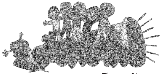
โดง เหวเกิง

สวัสดิ์ครับ น้องๆ ชาวชนที่รัก ฉบับนี้ขอนำเสนอ "บทราฟิง" จากศาสนของสมเด็จพระสันตะปาปา เบนเนดิกต์ ที่ 16 ในโอกาสวันเยาวชนโลกครั้งที่ 27 ค.ศ. 2012 กันตอนะครับ "จงชื่นชมในองค์พระผู้เป็นเจ้า ทุกเวลาเถิด" (ฟป 4:4) ซึ่งในฉบับนี้ขอนำเสนอเป็น ตอนจบครับ