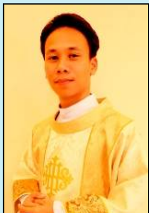
สังฆานุกรไพศาล ราชกิจ