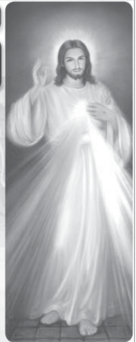
พระเยซูเจ้าข้า ลูกลงใจในพระองค์