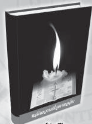
หนังสือ หลักความเชื่อคาทอลิก

สนใจติดต่อ : แผนกคริสตศาสนธรรมอัครสังฆมณฑลกรุงเทพฯ 57 อาคารคาทอลิกแพร่ธรรม ซอยเจริญกรุง 40 บางรัก กรุงเทพฯ 10500 โทรศัพท์ 0-2237-5276, 0-2233-0338 โทรสาร : 0-2233-8159 Email : ccbkk@catholic.or.th www.kamsonbkk.com