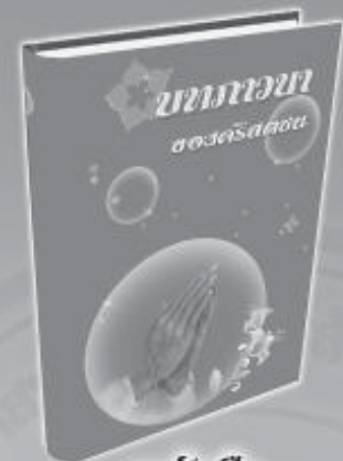
หนังสือ บทภาวนาของคริสตชน