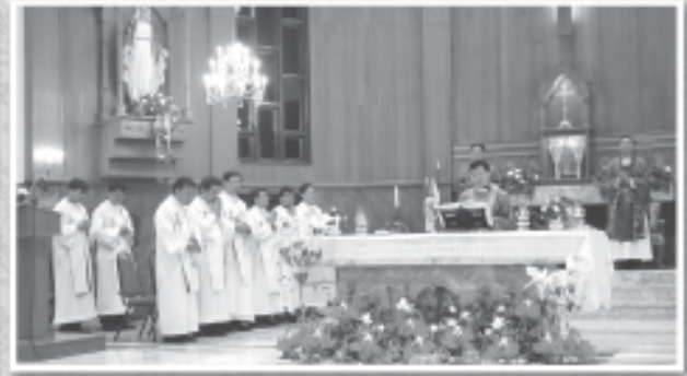
14 กุมภาพันธ์ 2553