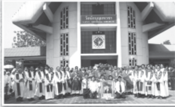
19 กุมภาพันธ์ 2551