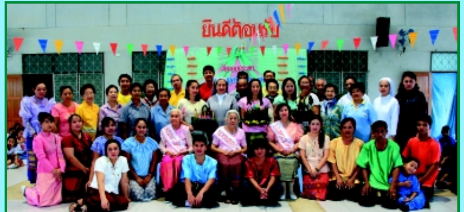
“สืบสานตำนานไทย” ศูนย์อภิบาลผู้สูงอายุเซนต์หลุยส์ (ลำไทร) จัดงานวันลอยกระทง “สืบสานตำนานไทย” มีการประกวดนางนพมาศ-กระทง และการแสดงของพนักงาน มีผู้ร่วมงาน 200 คน เมื่อวันที่ 28 พฤศจิกายน 2012