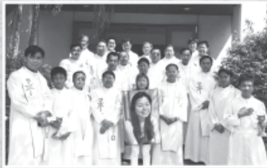
14 กุมภาพันธ์ 2552