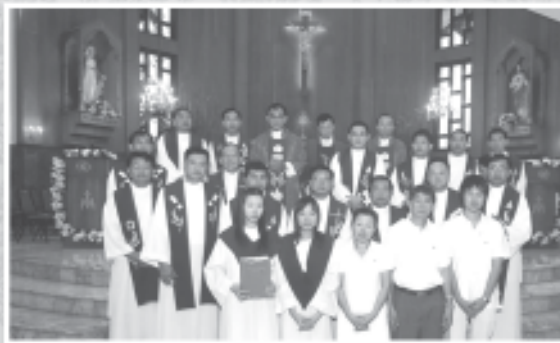
14 กุมภาพันธ์ 2554