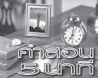
พระคุณเจ้าวีระ อากรณรัตน์