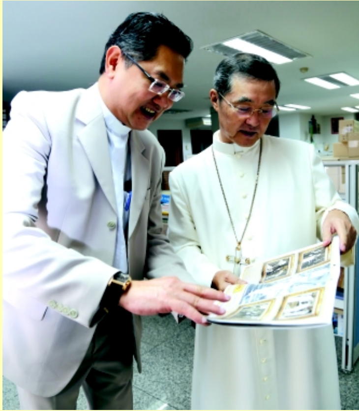
ภาพประทับใจ พระสมณทูตเยียมออฟฟิสอุดมสาร พระอัครสังฆราชพอล ชาง อิน-นัม เอกอัครสมณทูตวาติกัน ประจำประเทศไทย เยี่ยมสำนักงานสื่อมวลชนคาทอลิกประเทศไทย แผนกอุดมสาร วันที่ 9 กันยายน 2013