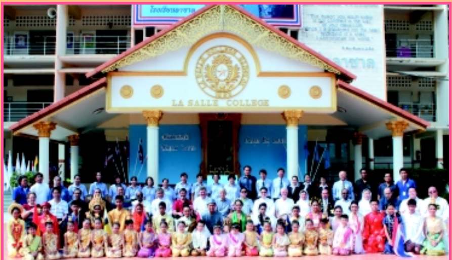
“ต้อนรับ” คณะผู้บริหาร คณะครูและนักเรียนโรงเรียนลาซาลให้การต้อนรับ อธิการเจ้าคณะภราดาลาซาล สมาชิกของ Lasallian East Asia District Council (LEAD) ระหว่างวันที่ 23-26 สิงหาคม 2013