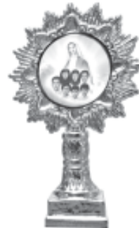
องค์เล็ก

คณะกรรมการบุญราศีทั้งเจ็ดแห่งสองคอน คณะผู้รับใช้บุญราศีแห่งสองคอน