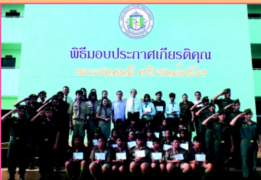
“ประกาศเกียรติคุณ” โรงเรียนเซนต์ฟรังซิสเซเวียร์แพร่ มอบใบประกาศเกียรติคุณ “เยาวชนคนดี ศรีเซนต์ฟรังฯ” ให้กับนักเรียนที่มีความซื่อสัตย์สุจริต ที่เก็บของแล้วส่งคืนเจ้าของ เนื่องในวันเยาวชนแห่งชาติ 2556 เพื่อเป็นขวัญกำลังใจแก่นักเรียนที่ทำความดี โดยมีมาสเตอร์สถาพร มังกร ผู้อำนวยการ เป็นประธานในการมอบ