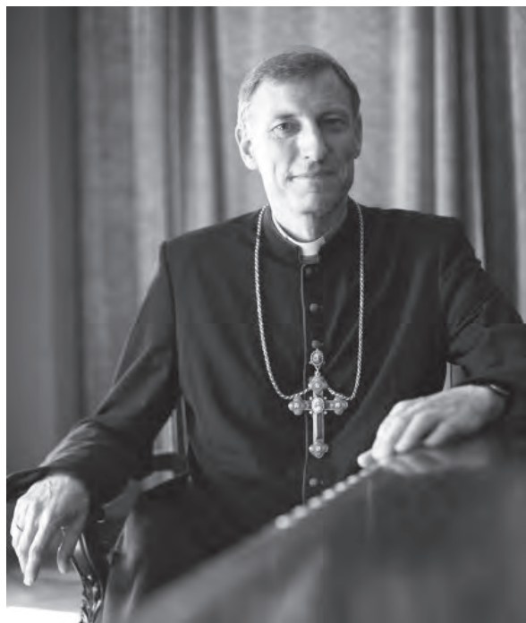
พระอัครสังฆราชบิเจฟส์ สแตนเควิกส์ แห่งเมืองริกา ประเทศลัตเวีย

“แม่อายุได้ 40 ปี แต่คุณหมอบอกท่านหนึ่งตั้งใจจะทำแท้ง หมอบอกคุณแม่พ่อว่า ‘เธอแก่แล้วและไม่เป็นการฉลาดที่จะมีลูกอีกคนหนึ่ง’ “แต่คุณแม่ของท่านตัดสินใจที่จะมีลูก และบังเอิญหนูน้อยคนนั้นได้มาเป็นพระอัครสังฆราชแห่งริกา ผู้หญิงนับพันในประเทศลัตเวียต้องเผชิญกับสถานการณ์ที่ไม่เข้าค่ายไม่ออกแบบที่แม่ของท่านเผชิญเมื่อทศวรรษที่ผ่านมา ในปีค.ศ. 2002 รัฐบาลผ่านกฎหมายทำแท้ง เพื่อต่อต้านท่านจึงเขียนบทความ “ทำไมผมถึงโชคดี?” พระอัครสังฆราชจากประเทศลัตเวียเล่าต่อว่า