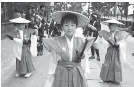
เด็กนักเรียนญี่ปุ่นทั้งสี่ใส่ชุดแบบสามเณรในยุคตั้งบ้านเณรแห่งแรกใน ค.ศ. 1852 ยกเว้นไม่พกดาบ

● พระสงฆ์เยสุอิต คุณพ่อเลสซานโดร วาลิกญาโน เดินทางไปประเทศญี่ปุ่น ใน ค.ศ. 1573 นับเป็นมิสชันนารีชาวอิตาเลียนคนแรกที่เดินทางมาถึงประเทศแถบเอเชีย บัดนี้บ้านเณรที่ท่านก่อตั้งในเมืองนางาซากิ กลายเป็นโรงเรียนเตรียมอุดมศึกษา บรรดานักเรียนยังคงเก็บเรื่องราวเป็นความทรงจำที่มีชีวิต เพื่อเป็นเครื่องหมายของการรู้คุณต่อท่าน ริซึ ทาคากิ เล่าต่อว่า “นี่เป็นเสื้อผ้าแบบที่สามเณรในยุคเริ่มต้นบ้านเณรสวมใส่ที่เราสวมอยู่นี้ทำขึ้นมาใหม่ให้เหมือนแบบดั้งเดิมที่นักเรียนของคุณพ่อเลสซานโดร วาลิกญาโนสวมใส่”