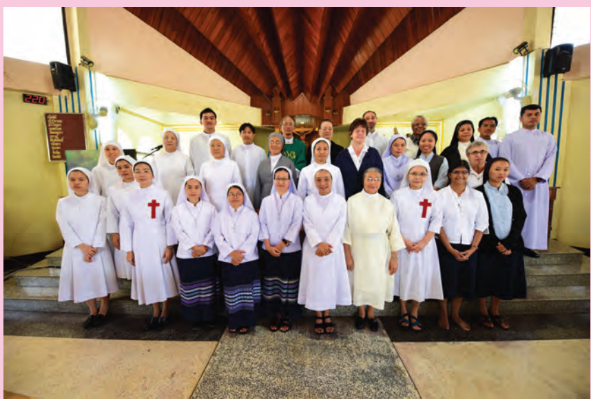
วันนักบวช สังฆมณฑลนครสวรรค์ พระสังฆราชยอแซฟ พิบูลย์ วิสิฐนนทชัย เป็นประธานพิธีบูชาขอบพระคุณวันนักบวช ของเขต 3 สังฆมณฑลนครสวรรค์ เมื่อวันที่ 8 กุมภาพันธ์ 2015 ที่วัดนักบุญเทเรซา แม่สอด จ.ตาก