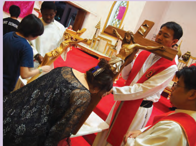
วันศุกร์ศักดิ์สิทธิ์ 3 เมษายน 2015 วัดพระมหาไถ่ชอยร่วมฤดี