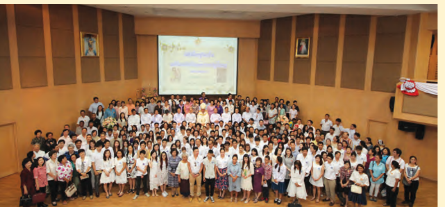
พระคาร์ดินัลฟรังซิสเซเวียร์ เกรียงศักดิ์ โกวิทวาณิช เป็นประธานในพิธีเอฟฟาราและเจมน้ำมันศีลล้างบาปแก่คริสตชนใหม่ วันที่ 4 เมษายน 2015 ที่โรงเรียนอัสสัมชัญศึกษา