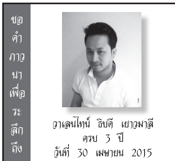
คุณ คำ ภา ณา เพื่อ ระ ลึก ถึง อาสน์ไชนี่ อิมดี เยอูมาตี ครบ 3 ปี วันที่ 30 เมษายน 2015

วัดพระจิตเจ้า แม่สรวย อ.แม่สรวย จ.เชียงราย ฉลองวัดและฉลอง 25 ปี ศูนย์พระจิตเจ้า วันเสาร์ที่ 23 พฤษภาคม เวลา 10.00 น. พระสังฆราชฟรังซิส เซเวียร์ วีระ อาภรณ์รัตน์ เป็นประธาน