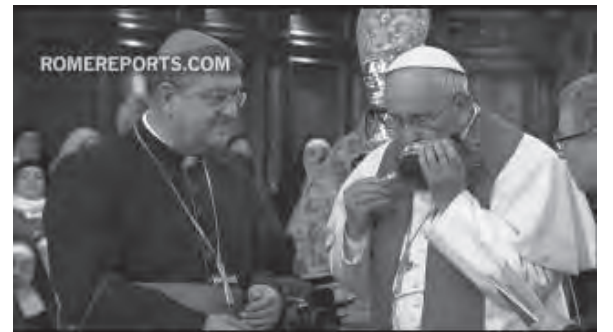
สมเด็จพระสันตะปาปาฟรังซิสทรงจูบเคารพพระธาตุโลหิตนักบุญเยนนาโร ที่เปลี่ยนสภาพเป็นของเหลว

● ก่อนจะทรงจากไปพระองค์ทรงสวดภาวนาบทข้าแต่