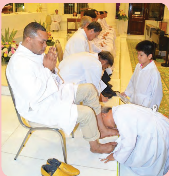
วันพฤหัสบดีศักดิ์สิทธิ์ 2 เมษายน 2015 ล้างเท้าอัครสาวก วัดแม่พระฟาติมา ดินแดง