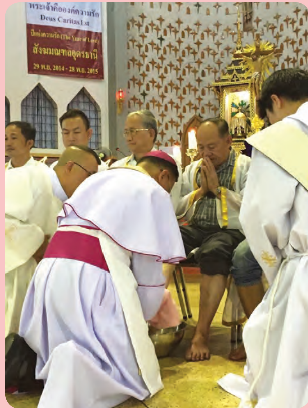
วันพฤหัสบดีศักดิ์สิทธิ์ 2 เมษายน 2015 ล้างเท้าอัครสาวก อาสนวิหาร พระมารดา นิจามูเคราะห์ อุดรธานี