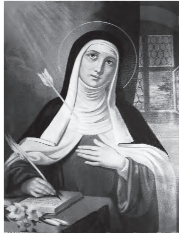
นักบุญเทเรซาแห่งอาวีลา นักปราชญ์ของพระศาสนจักร

● เธอได้รับสถาปนาเป็นบุญราศี โดยสมเด็จพระสันตะปาปาเปาโล ที่ 5 ในปี ค.ศ. 1614 และได้รับสถาปนาเป็นนักบุญโดยสมเด็จพระสันตะปาปาเกรโกรี ที่ 14 ในปี ค.ศ. 1622 และสมเด็จพระสันตะปาปาเปาโล ที่ 6 ทรงประกาศเป็นนักปราชญ์ของพระศาสนจักรในปี ค.ศ. 1970 เธอเป็นสตรีคนแรกที่ได้รับประกาศเกียรติคุณนี้ ✠