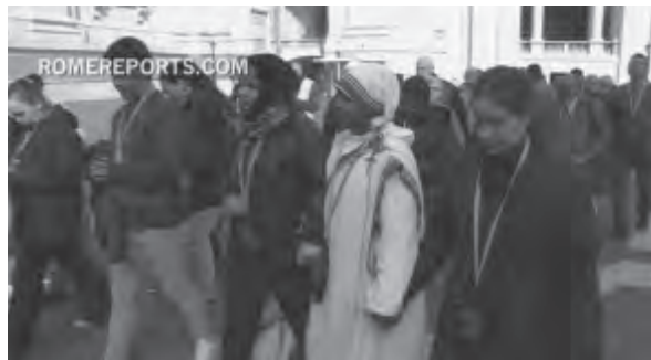
กลุ่มคนเร่ร่อน 150 คนได้รับสายคล้องคอนักท่องเที่ยวเข้าชมสำนักวาติกัน

การเข้าเยี่ยมชมวัดน้อยซิสทีน พร้อมด้วยแขกรับเชิญพิเศษมากมาย สมเด็จพระสันตะปาปาฟรังซิสทรงสร้างความแปลกใจด้วยการทรงเข้ามาทักทายพวกเขาจนถึง 20 นาที คนเร่ร่อนเล่าว่า “พระสันตะปาปาทรงเดินเข้ามาและพอพวกเราเห็น เสียงปรบมือก็ดังขึ้นอย่างพร้อมเพรียงแถมด้วยน้ำตาแห่งความปลาบปลื้มก็ไหลออกมา” มูโร เสริมว่า “เป็นเรื่องงดงามมาก เฉพาะอย่างยิ่งสำหรับผมซึ่งไม่เคยได้เข้ามาที่นี่มาก่อนเลย