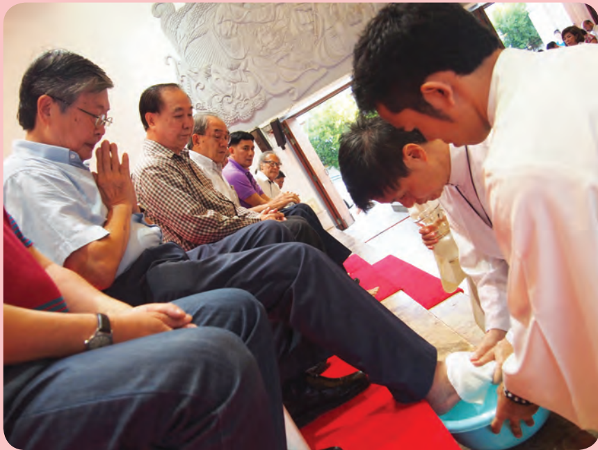
วันพฤหัสบดีศักดิ์สิทธิ์ 2 เมษายน 2015 ล้างเท้าอัครสาวก วัดพระมหาไถ่ ซอยร่วมฤดี