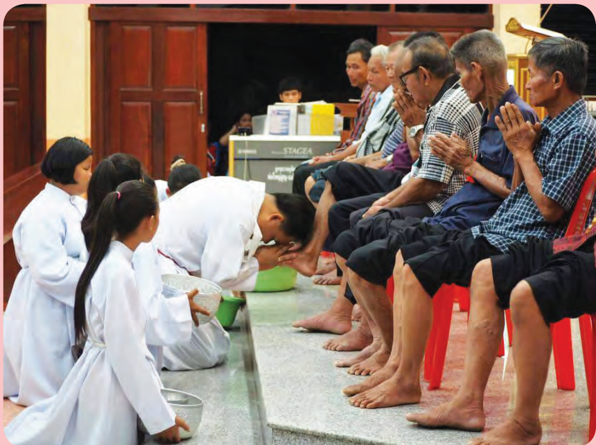
วันพฤหัสบดีศักดิ์สิทธิ์ 2 เมษายน 2015 ล้างเท้าอัครสาวก วัดนักบุญยอแซฟ บ้านหนองทามน้อย จ.ศรีสะเกษ