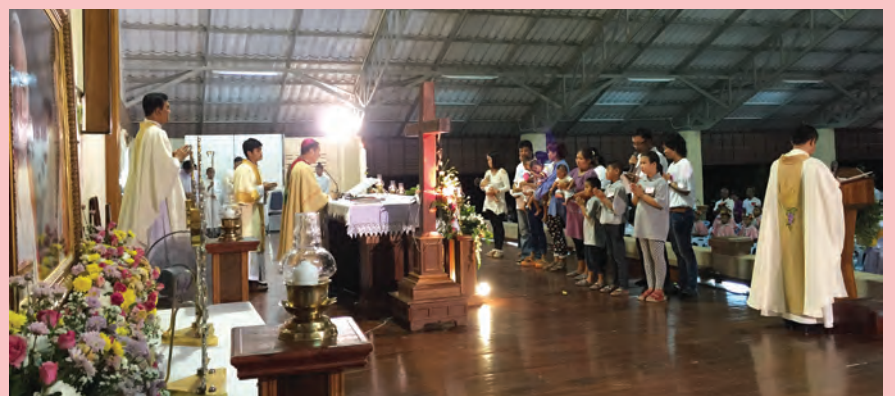
พระสังฆราชยอแซฟ ชูศักดิ์ สิริสุทธิ์ เป็นประธานในพิธีโปรดศีลล้างบาปศีลมหาสนิทครั้งแรก ศีลกำลัง และรื้อฟื้นคำมั่นสัญญาแห่งศีลล้างบาปแก่นักเรียนคำสอน ถ่ายคำสอนฤดูร้อน สังฆมณฑลนครราชสีมา ประจำปี 2015 เมื่อวันที่เสาร์ศักดิ์สิทธิ์ 4 เมษายน 2015 ที่วัดแม่พระคนกลางแจกจ่ายพระหรรษทาน โลกปราสาท จ.บุรีรัมย์