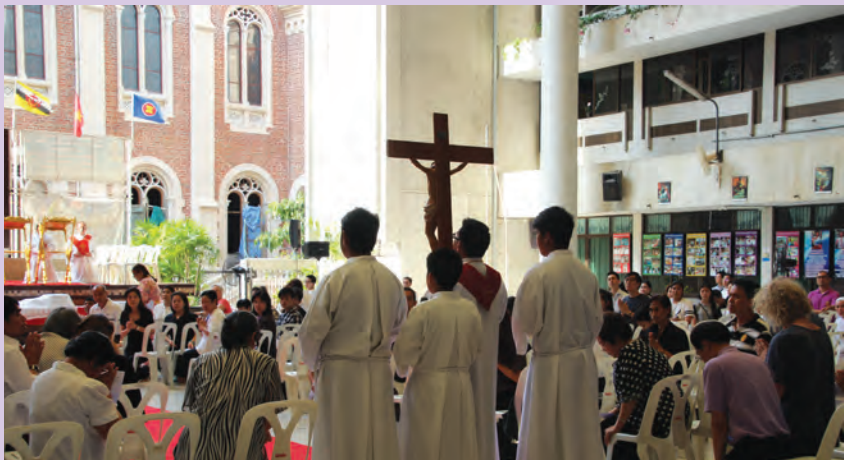
วันศุกร์ศักดิ์สิทธิ์ 3 เมษายน 2015 อาสนวิหารอัสสัมชัญ ใช้สถานที่โรงเรียนอัสสัมชัญศึกษา