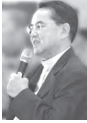
บ.สันติสุข