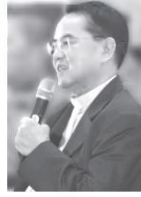
บ.สันติสุข