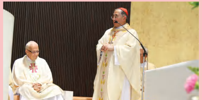
พระคาร์ดินัลฟรังซิสเซเวียร์ เกรียงศักดิ์ โกวิทวาณิช เป็นประธานในพิธีบูชาขอบพระคุณโอกาสฉลอง 60 ปี คณะเยสุอิต เมื่อวันที่ 27 กันยายน 2015 ที่วัดบ้านเซเวียร์ อนุสาวรีย์ชัยสมรภูมิ