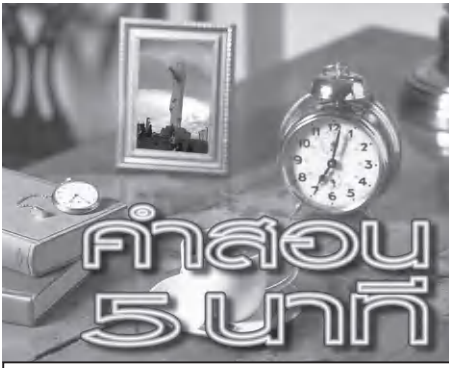
พระคุณเจ้าวีระ อภรณ์รัตน์