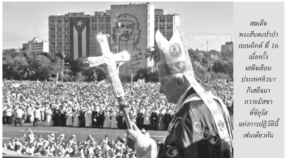
สมเด็จพระสันตะปาปาเบเนดิกต์ ที่ 16 เมื่อครั้งเสด็จเยือนประเทศคิวบา ก็เสด็จมาถวายมิสซาที่จัตุรัสแห่งการปฏิวัตินี้เช่นเดียวกัน