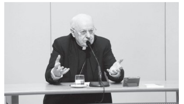
พระคาร์ดินัลลอเรนโซ บัลดิเชรี