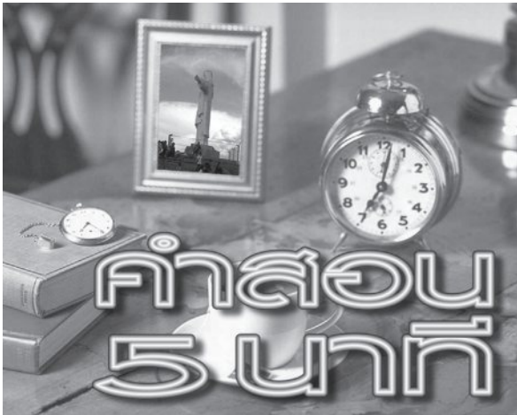
พระคุณเจ้าวีระ อภรณ์รัตน์