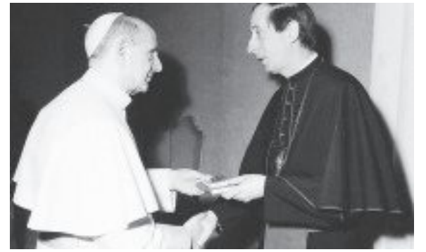
พระสังฆราชเคลาส์ เฮมเมล เข้าเฝ้าสมเด็จพระสันตะปาปาเปาโล ที่ 6

บรรดาพระสังฆราชที่มาพบปะกัน มาจากวัฒนธรรม ทวีป และสภาพการเมืองที่แตกต่างกัน การแบ่งปันประสบการณ์ พยานชีวิต ทำให้เราเห็นความสำคัญของการเป็นหนึ่งเดียวกัน (เป็นพิเศษบรรดาพระสังฆราชที่มาจากประเทศ ซีเรีย อิรัก เลบานอน และปาเลสไตน์ ซึ่งกำลังถูกเบียดเบียน) มีการประชุมกลุ่มภาษา และสรุปการเสวนาในที่ประชุมใหญ่ เน้นสองประการ คือ จะกระตุ้นมิตรภาพเพื่อรับใช้ประชากรของพระเจ้าด้วยกัน และการเจริญชีวิตท่ามกลางความขัดแย้งเพื่อพยายามนำพาสู่การเป็นหนึ่งเดียวกันอย่างไร