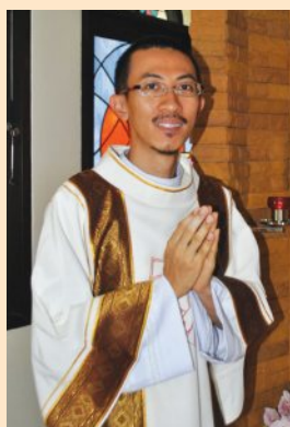
สังฆานุกรขวัญชัย