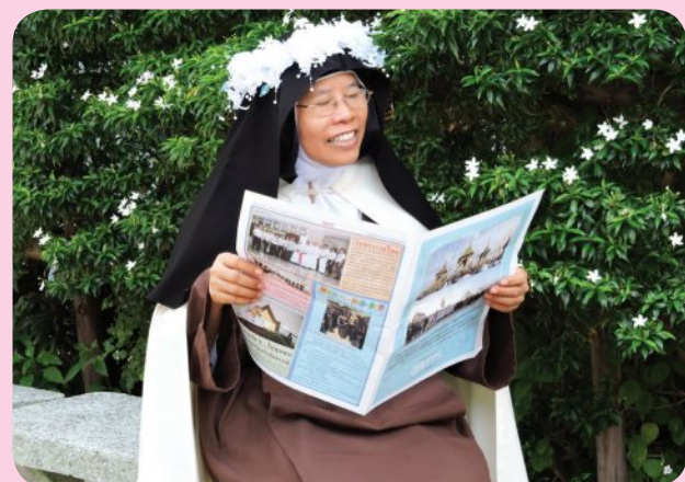
ภาพพักตา เซอร์มารี อันเดรีย แห่งพระแม่ สกลสงเคราะห์ มีความสุขกับการอ่าน อุดมสาร