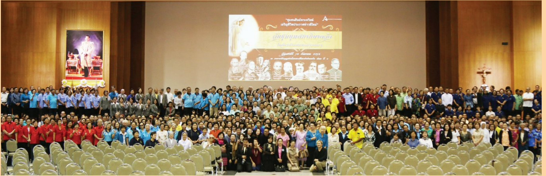
พระคาร์ดินัลฟรังซิสเซเวียร์ เกรียงศักดิ์ โกวิทวาณิช เป็นประธานพิธีบูชาขอบพระคุณ งานชุมนุมสภาภิบาลวัดในอัครสังฆมณฑลกรุงเทพฯ “ชุมชนศิษย์พระคริสต์ เจริญชีวิตประกาศข่าวดีใหม่” และมอบใบแต่งตั้งสภาภิบาล วันเสาร์ที่ 15 กันยายน 2018 ที่อาคารนักบุญยอห์นปอลที่ 2 อ.สามพราน จ.นครปฐม