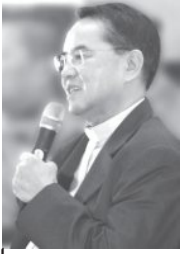
บ.สันติสุข www.salit.org