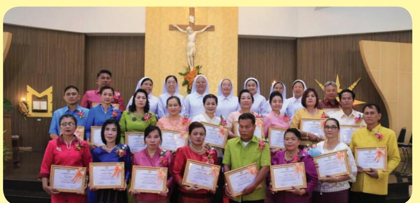
“ฉลองเกิดทุนทางเงิน” วันเสาร์ที่ 15 กันยายน 2018 คณะภคินีรักกางเขนแห่งอัครราชธานี ได้จัดฉลองเกิดทุนทางเงินซึ่งเป็นการฉลองคณะประจำปี ในพิธีเดียวกันนี้ได้มีการจัดฉลองครบ 70 ปี 60 ปี และ 25 ปี ชีวิตนักบวชของสมาชิกในคณะ พิธีแต่งตั้งฆราวาสรักกางเขน อัครราชธานี รุ่นที่ 4 และพิธีมอบเกียรติบัตรแก่ครูในโรงเรียนเครือรักกางเขนที่อุทิศตนในการทำงานครบ 35, 30, 25 และ 20 ปี โดยพระสังฆราชฟิลิป บรรจง ไชยรา เป็นประธาน ร่วมกันนี้ทางสังฆมณฑลอุบลฯ ได้ประกาศเปิดเรื่องฉลอง 350 ปีมิสซังสยาม ค.ศ. 1669 - ค.ศ. 2019 โดยมีสัตบุรุษมาร่วมพิธีประมาณ 1,000 คน ที่อาสนวิหารแม่พระนิรมลอุบลฯ

ส่งภาพข่าวได้ที่กองบรรณาธิการอดมสาร E-mail: udomsarn@cbct.net [Wá .jpg ความละเอียด 3MB ขึ้นไป