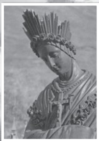
แม่พระประจักษ์ ลา ซาล็แต้