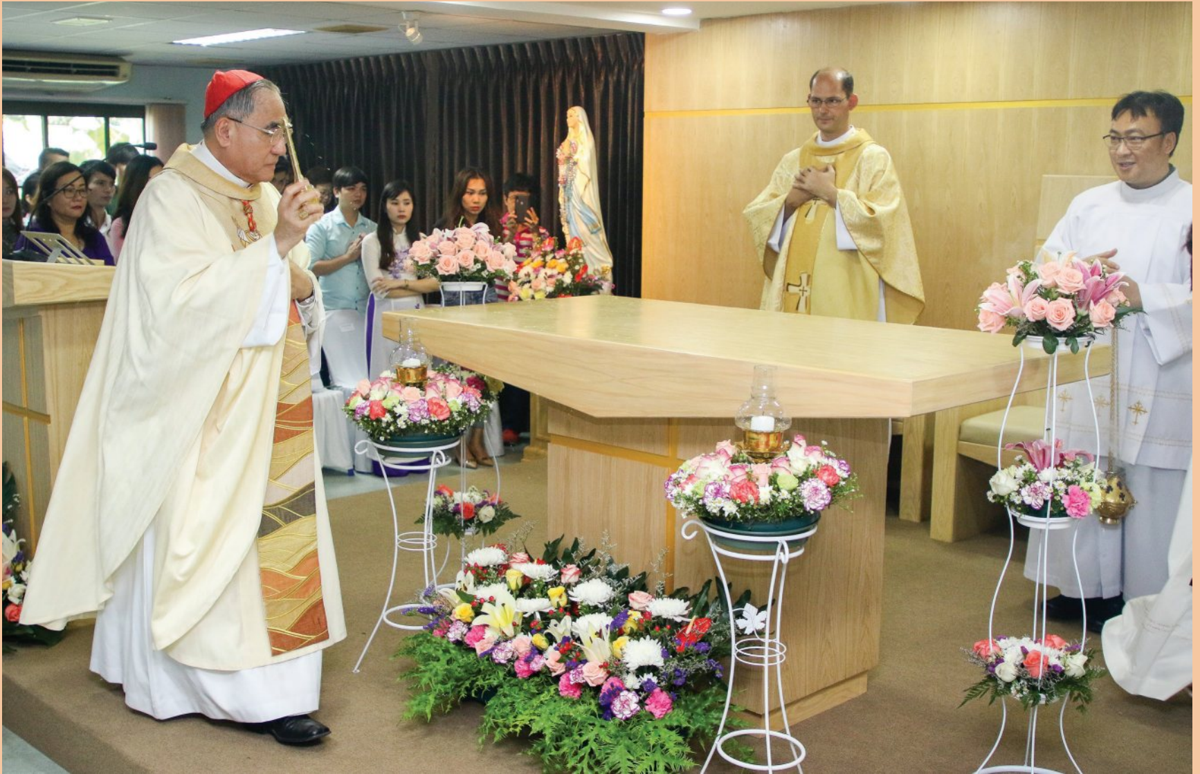
วันอาทิตย์ที่ 28 ตุลาคม 2018 พระคาร์ดินัลฟรังซิสเซเวียร์ เกรียงศักดิ์ โกวิทวาณิช เป็นประธานพิธีบูชาขอบพระคุณ โอกาสฉลองนักบุญยูดา อัครสาวก ระหว่างพิธี มีการเสกพระแท่น และตู้ศีล ที่วัดนักบุญยูดา อัครสาวก ชินเขต โอกาสนี้พระคุณเจ้าได้เปิดวัดนี้อย่างเป็นทางการ ในการฉลองวัดครั้งแรก ในวันอาทิตย์ วัดนักบุญยูดา อัครสาวก ชินเขต มีพิธีบูชาขอบพระคุณ 2 รอบ คือ เวลา 07.00 น. และ 11.00 น. คุณพ่อโยแซฟ อนุชา ชาวแพรกน้อย เป็นเจ้าอาวาส