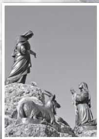
แม่พระประจักษ์ ทีโลส์ (เลสต์)