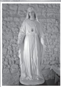
แม่พระประจักษ์ เปลเลอวัวแซง