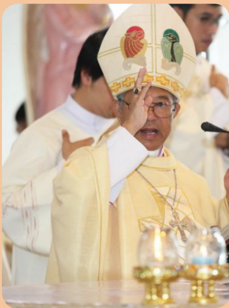
พระสังฆราชยอห์น บอสโก ปัญญา กฤษเจริญ เป็นประธานพิธีบูชาขอบพระคุณวันฆราวาสแพร่ธรรม สังฆมณฑลราชบุรี วันอาทิตย์ที่ 21 ตุลาคม 2018