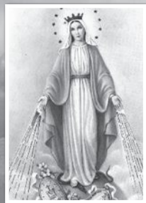
แม่พระ หรียญอัครราย

เดินทางวันที่ 27 มีนาคม - 10 เมษายน 2019 (15 วัน)