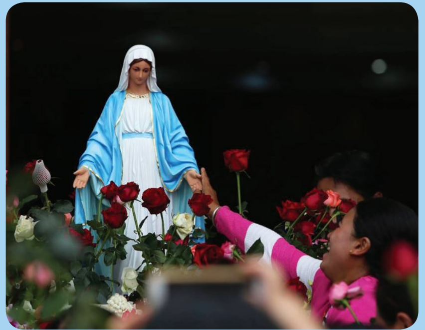
พระสังฆราชยอแซฟ วุฒิเลิศ แท้ล้อม เป็นประธานพิธีบูชาขอบพระคุณฉลองอาสนวิหารแม่พระบังเกิด เชียงราย วันเสาร์ที่ 13 ตุลาคม 2018