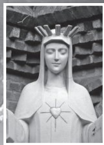
แม่พระประจักษ์ ทีเบแรง