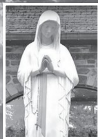
แม่พระประจักษ์ ทีบันเนา