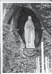
แม่พระประจักษ์ เมืองลูร์ด