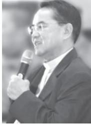
บ.สันติสุข www.salit.org