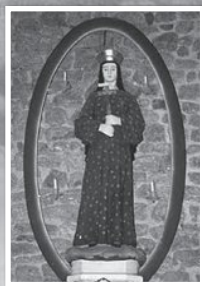
แม่พระประจักษ์ ทีปองแม็ง