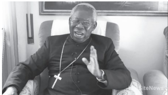
พระคาร์ดินัลฟรานซิส อารินเซ

● ท่านยังได้พูดถึงความสำคัญเรื่องกระแสเรียกของฆราวาส ท่านเน้นว่าบางครั้งมีการประณามบรรดาฆราวาสให้เดินไปสู่เรื่องการอนุรักษ์สิ่งแวดล้อมเชิงศาสนามากกว่าจะตอบสนองเสียงเรียกให้เราเสริมสร้างความ