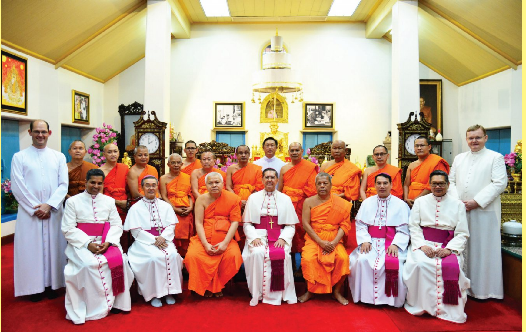
คณะผู้แทนสมเด็จพระสันตะปาปาฟรังซิส และพระสมณทูตวาติกัน ร่วมงานสมโภชพระอาราม 230 ปี วัดพระเชตุพนวิมลมังคลาราม (อ่านต่อหน้า 3)