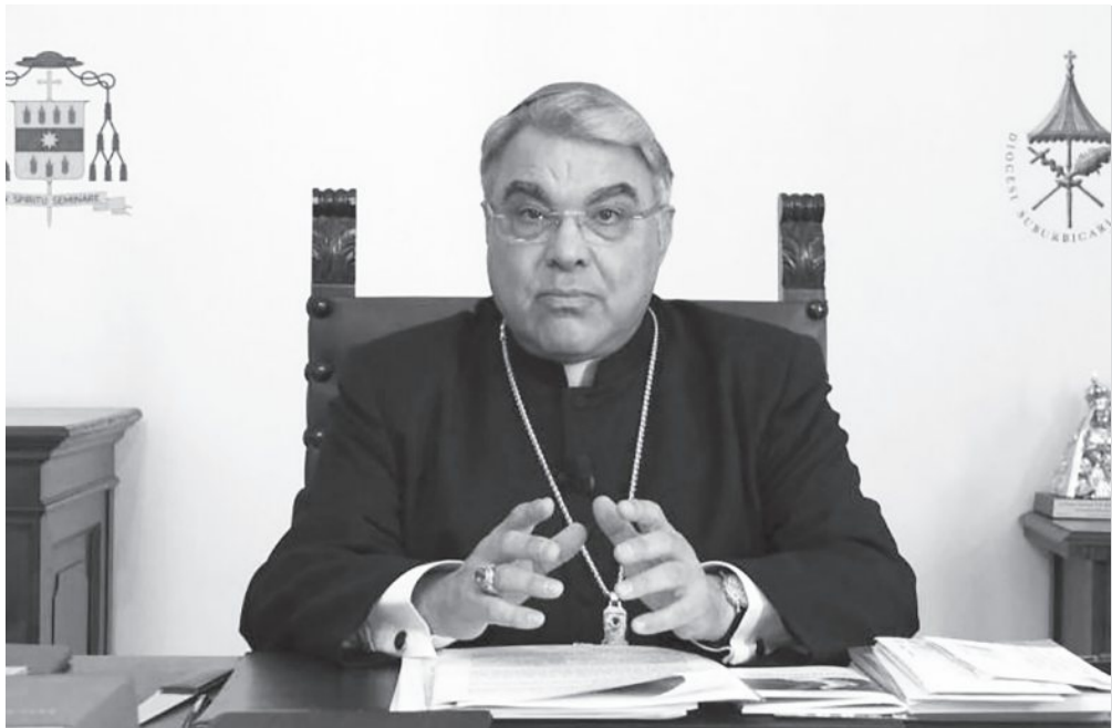
มงซินญอร์ มาร์แชลโล เสมราโร

● มงซินญอร์มาร์แชลโล เสมราโร กล่าวว่าสังฆธรรมนูญใหม่นี้พยายามจะปรับใช้ให้เข้ากับจิตตารมณ์การแพร่ธรรมที่พระสันตะปาปาฟรังซิสเสนอตั้งแต่แรกในสมณสมัยของพระองค์ : พระศาสนจักรเป็นเหมือน