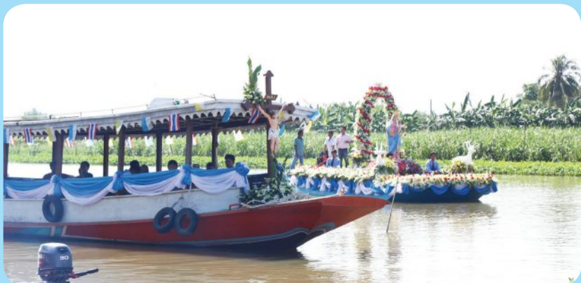
แม่พระทางเรือ ณ วัดแม่พระประจักษ์แห่งกุเวการ์แมด อ.สองพี่น้อง จ.สุพรรณบุรี คุณพ่อไพฑูรย์ หอมจินดา ประธานพิธีบูชาขอบพระคุณร่วมด้วยคุณพ่อคมสันท์ ยันต์เจริญ และคุณพ่อวิษณุกรณ์ เกตุภาพ วันเสาร์ที่ 27 ตุลาคม 2018