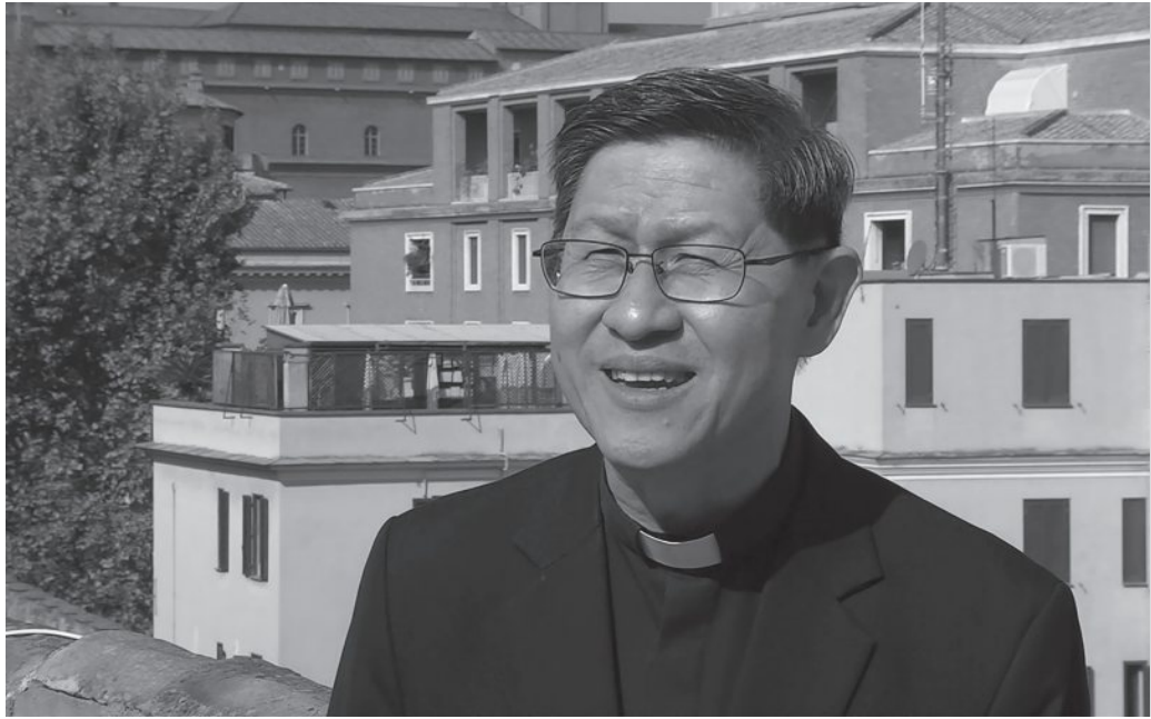
พระคาร์ดินัล หลุยส์ อันโตนิโอ ตาเกล

“บทสอนเรื่องนี้ดีมาก และก่อเกิดผลอย่างมาก ต่อคนหนุ่มอย่างพ่อให้รู้จักไตร่ตรองว่าชีวิตของพ่อสามารถเป็นการรับใช้พระศาสนจักร ไม่ใช่เพียงแค่บทสอนเราแค่นั้น ไม่ใช่เพียงแค่เรื่องความคิดแต่เป็นประสบการณ์งดงามของการได้พบปะกับผู้คน ผู้อุทิศตนหรือแม่แต่